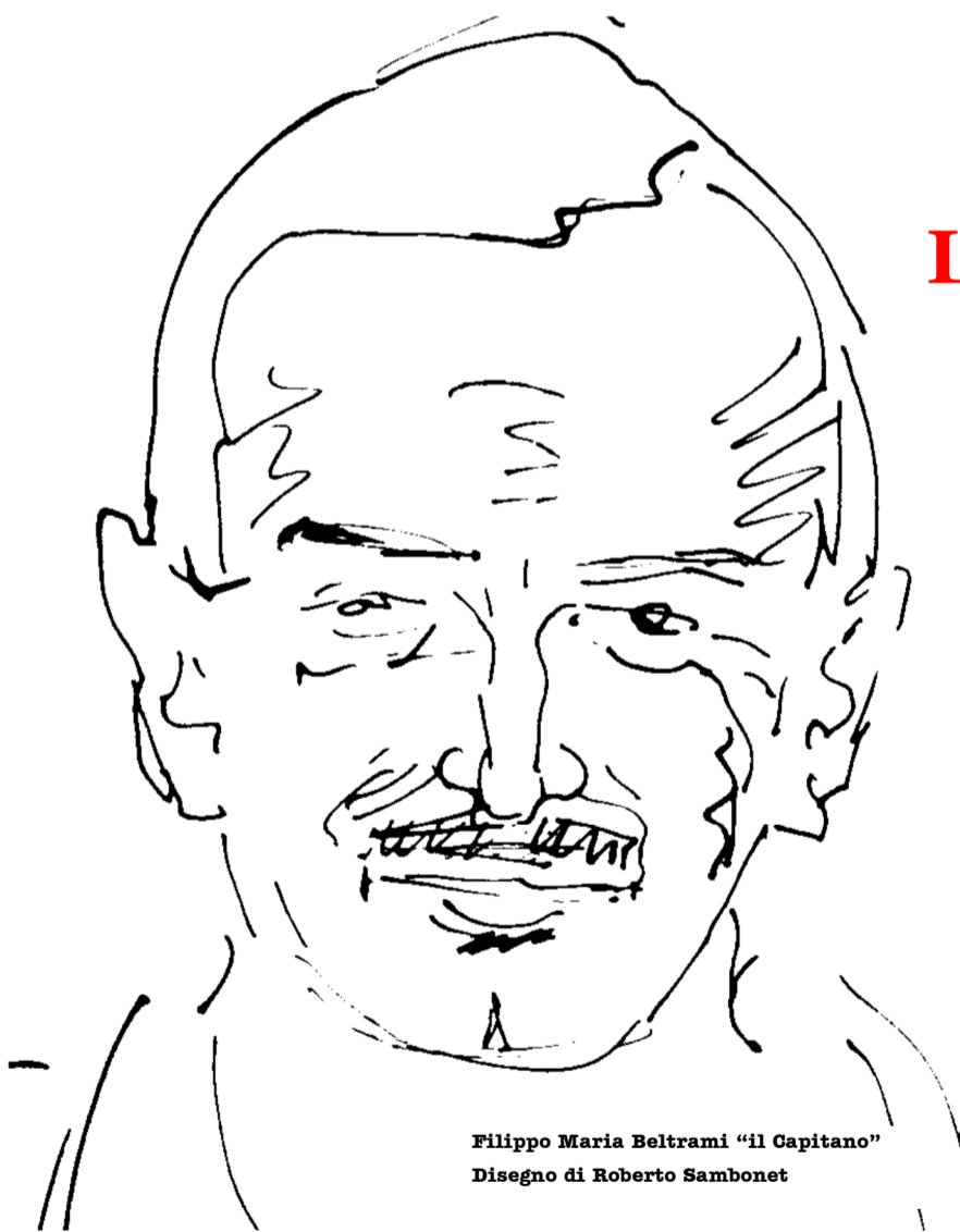
Filippo Maria Beltrami "il Capitano" Disegno di Roberto Sambonet