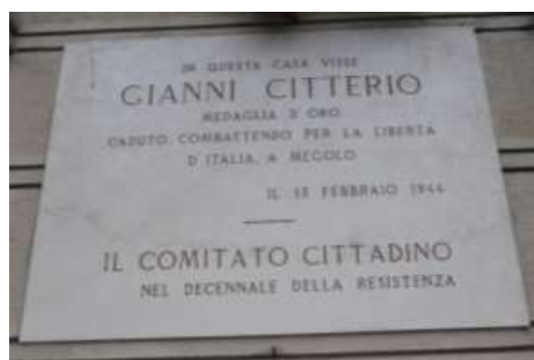
Piazza Citterio, 2