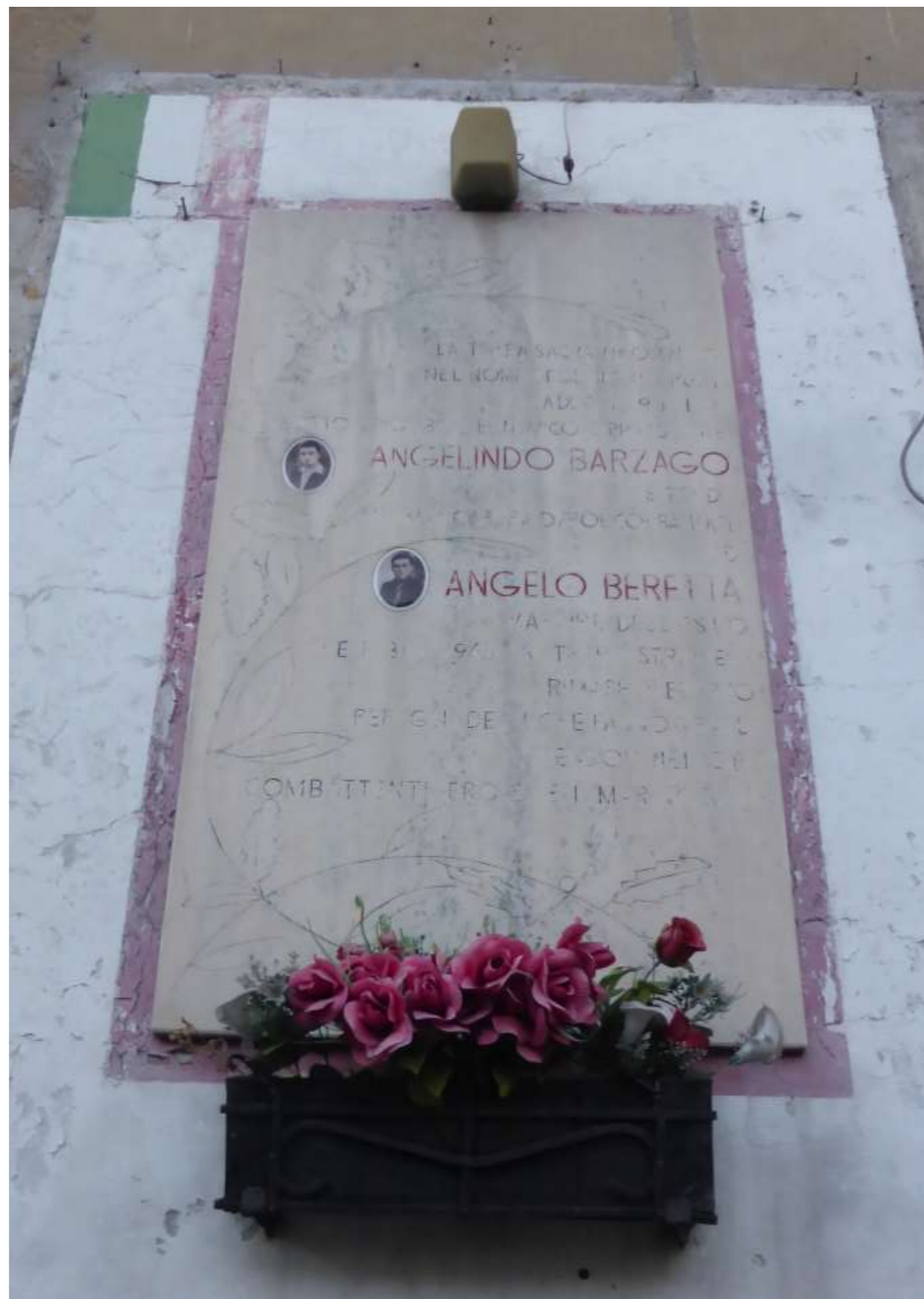
Via Sant'Alessandro, 5/A